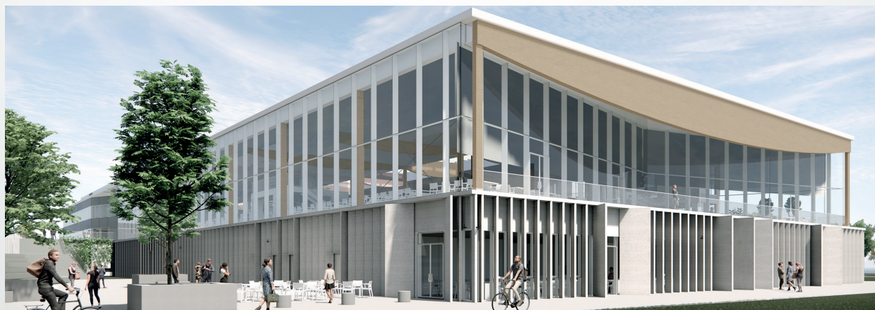
La Ruche, Campus Porte des Alpes de l'Université Lumière Lyon 2. © ALA architects

https://www.univ-lyon2.fr/universite/evolution-campus-pda/la-ruche-learning-centre